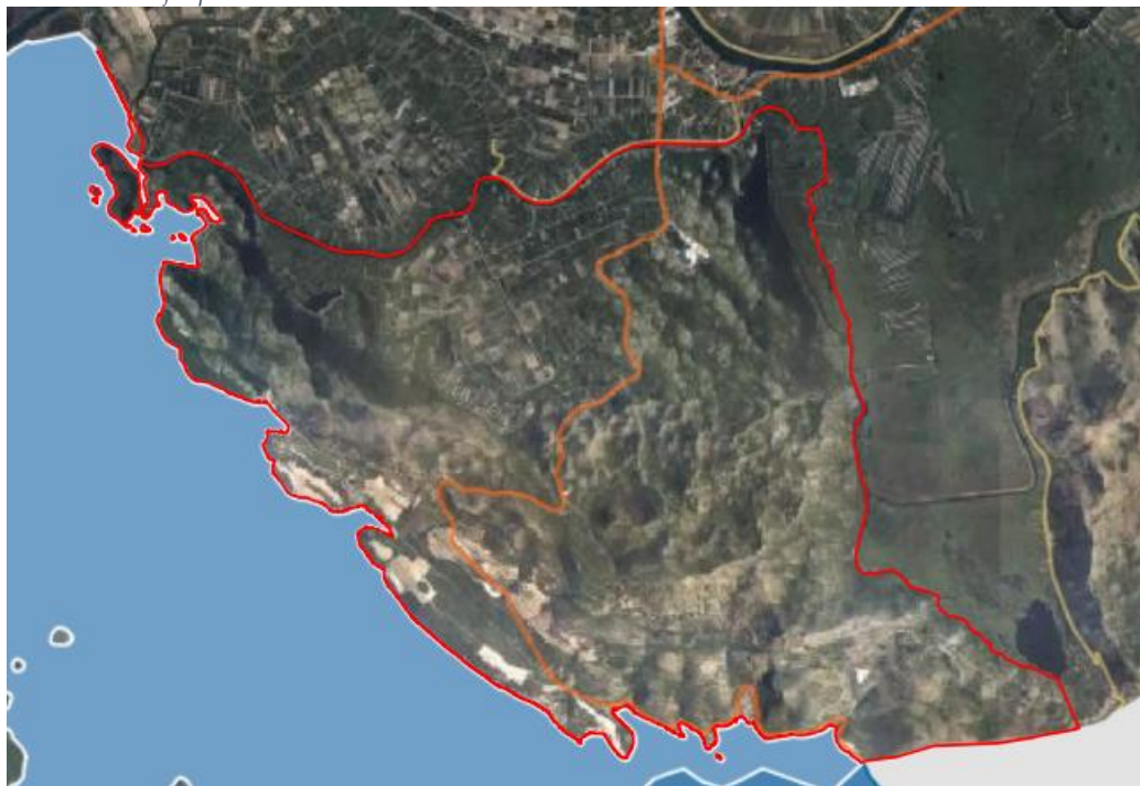
Slika 1. Položaj Općine Slivno